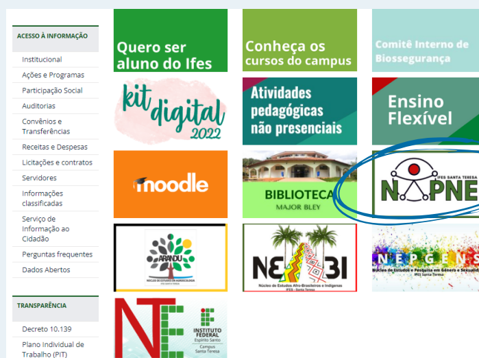
Figura 01: Acessos rápidos no site do IFES Santa Teresa.

2º - Descer a barra de rolagem até os acessos rápidos da página (Figura 01) e clicar no logo do NAPNE.