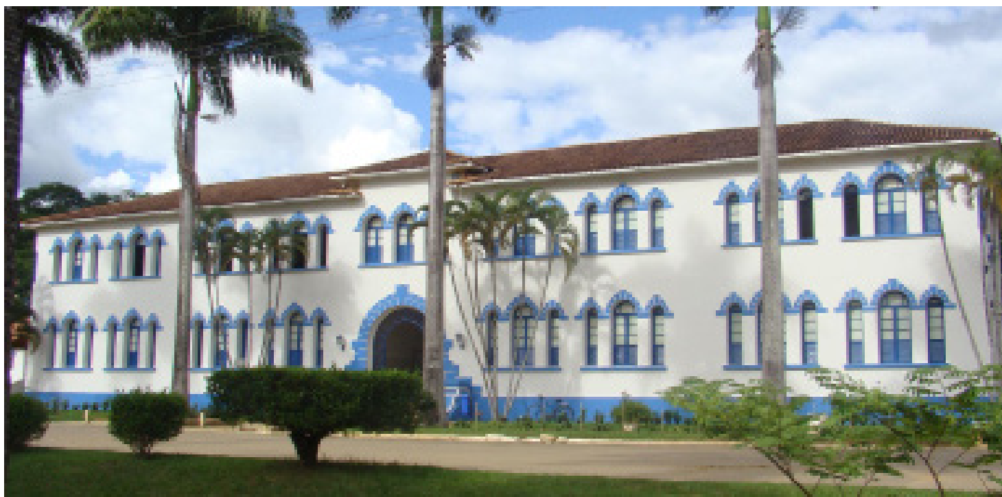
Instituto Federal do Espírito Santo - Campus Santa Teresa